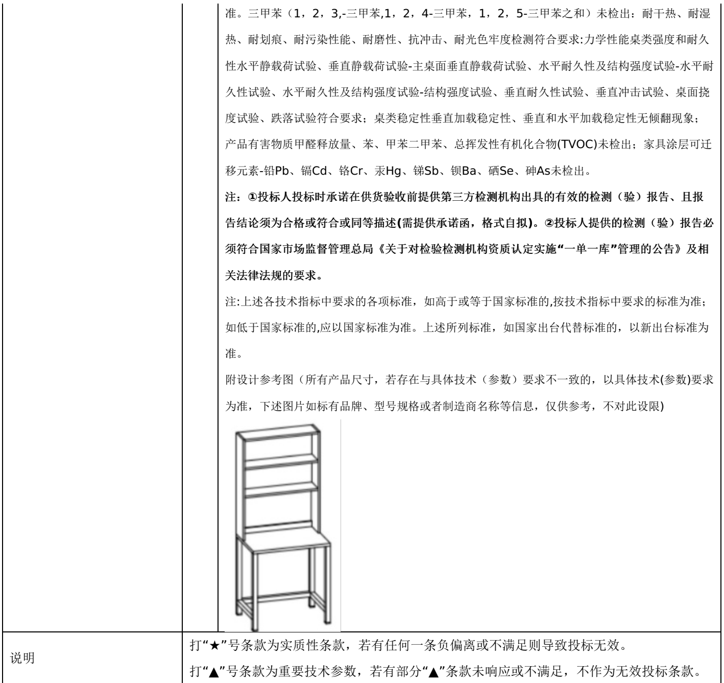
附表三：学生椅（课桌椅）