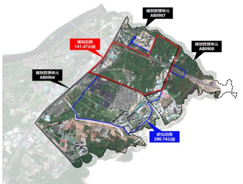
项目规划范围示意图

项目地块位于广州市白云区钟落潭镇，广州民营科技园美丽健康产业园东北侧，西至广从路，南至九佛西路，北侧和东侧分别紧邻从化区、黄埔区，规划面积约 141.47公顷 （研究范围约 290.74公顷 ）。涉及AB0904、AB0907、AB0908规划管理单元（面积约 628.26公顷 ）。