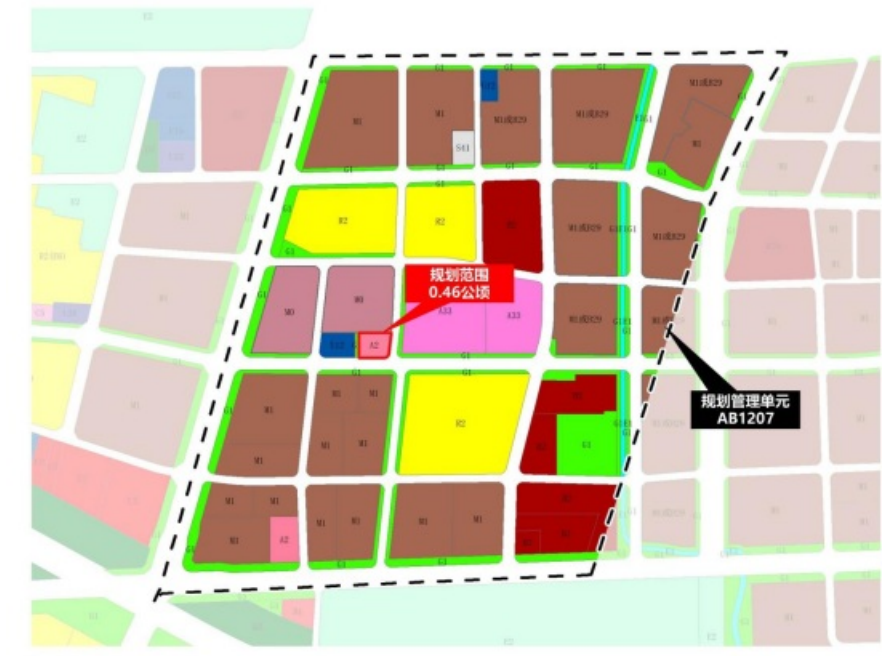
现行控规土地利用图