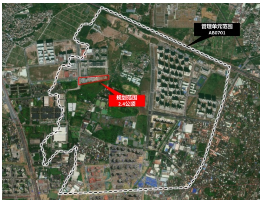
地块规划范围示意图

地块位于白云区江高镇，广州民营科技园都市消费园北部，初步划定本次控规优化范围用地面积约2.4公顷（36亩），范围涉及AB0701规划管理单元。