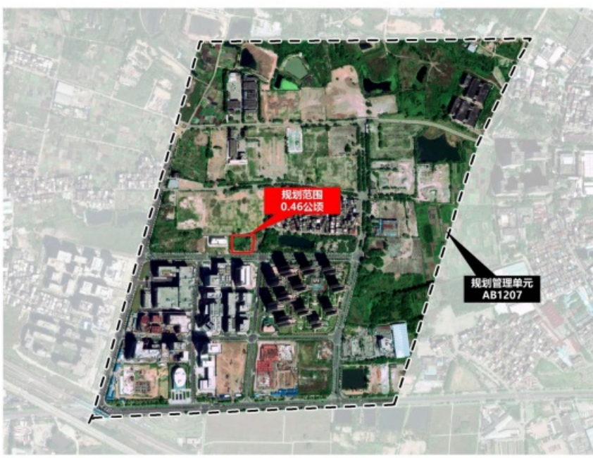
地块规划范围示意图

地块位于白云区龙归街，广州民营科技园核心区西片区，初步划定本次控规优化范围用地面积约0.46公顷（6.9亩），范围涉及AB1207规划管理单元。